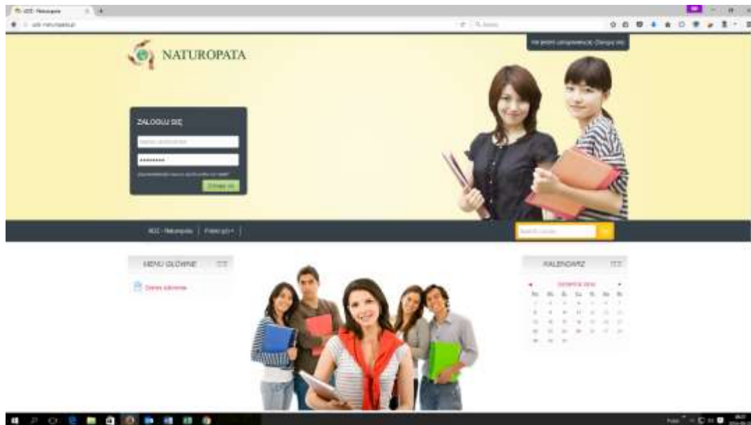
Rys. 1. Okno logowania do platformy ONLINE .

Po wpisaniu adresu i jego zatwierdzeniu, w oknie przeglądarki powinna otworzyć się strona logowania: