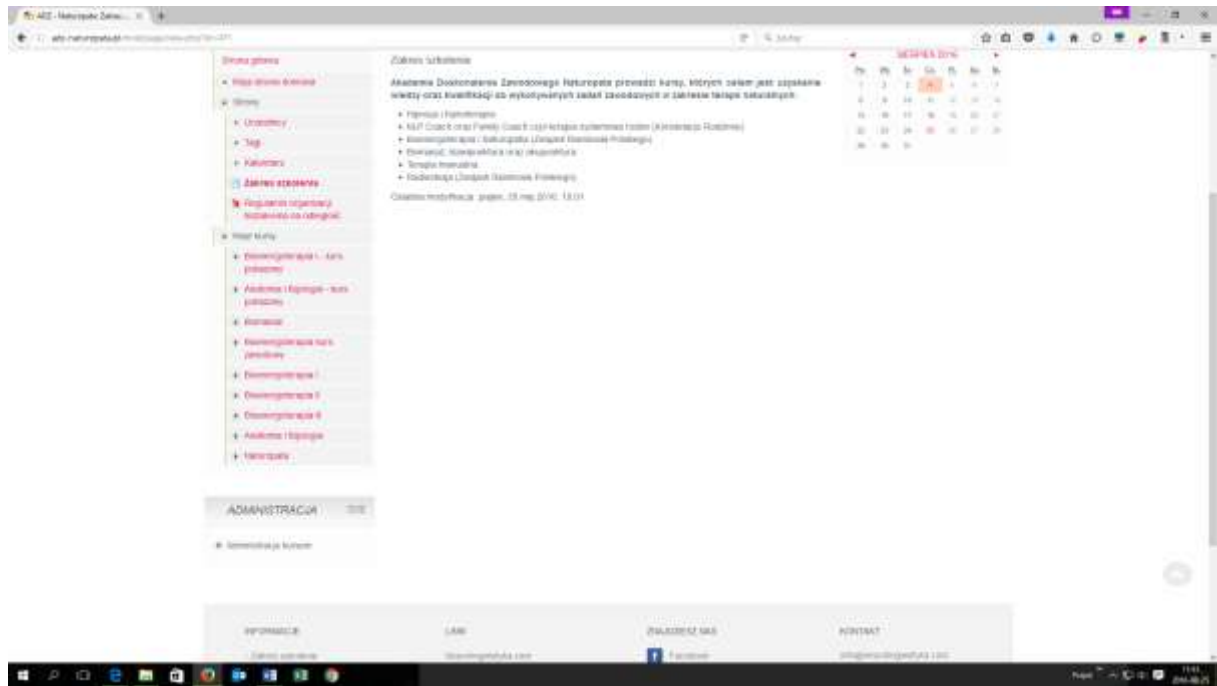
Rys. 3. Zakładka „Moje kursy”

Na stronie głównej platformy znajduje się lista kursów, które zostały opublikowane na platformie. Nie wszystkie kursy są dostępne dla Słuchaczy. Zalogowany Słuchacz może przejrzeć tylko te kursy, na które został zapisany (zakładka po prawej stronie „Moje kursy”). Czynności zapisu dokonuje Administrator strony.